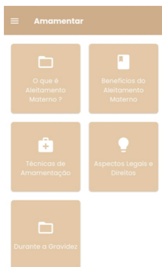
Figura II - Tela Principal do Amamentar

O Amamentar representa um avanço significativo para qualificar o cuidado de enfermagem no AM no puerpério imediato. Os resultados preliminares indicam potencial para otimizar a prática, porém validações futuras são essenciais para confirmar sua efetividade e aprimorar a ferramenta. Além disso, a integração entre tecnologia e saúde potencializa o protagonismo da enfermagem na atenção primária. O Amamentar tem potencial para contribuir não apenas para a padronização da prática, mas também para a valorização da atuação do enfermeiro.