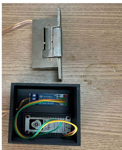
Figura 2 - Fechadura com o dispositivo.

Os resultados confirmam a eficácia do sistema na melhoria da segurança e na gestão de acessos às salas, oferecendo maior agilidade e praticidade. A combinação de RFID e Bluetooth demonstrou ser uma solução robusta, proporcionando flexibilidade no controle de entradas. Para melhorar ainda mais o sistema, sugere-se a implementação de funcionalidades adicionais, como a verificação de permissões para salas específicas e a abertura remota, o que traria maior controle e monitoramento das entradas e saídas.