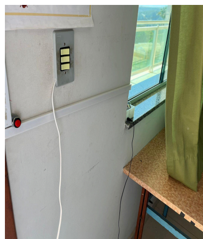
Figura 4 - Botão interno das portas.