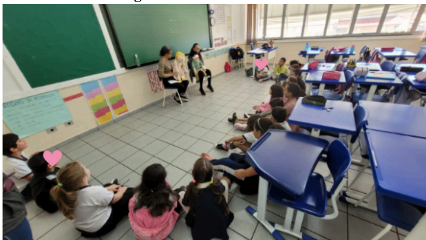
Figura 1 - Teatro de fantoches

2.1. Teatro de Fantoches: O teatro de fantoches foi utilizado como uma ferramenta pedagógica para explorar diferentes configurações familiares e promover a discussão sobre o papel da família na vida escolar. As crianças participaram da criação (apresentação) e manipulação dos fantoches, o que permitiu que elas expressassem suas ideias e sentimentos sobre o tema de forma lúdica e interativa. O teatro foi realizado em grupo (para o grupo de crianças), com a presença da professora, e incluíram debates sobre o que é família e formas de família. A Figura 1 ilustra essa etapa.